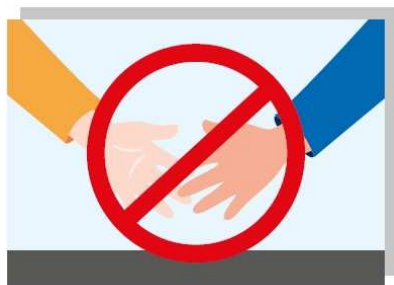
Nie podawaj ręki