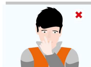
Nie dotykaj twarzy