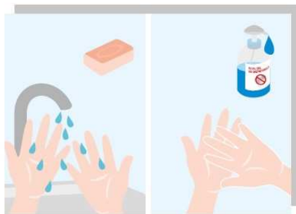
Zdezynfekuj ręce odpowiednimi środkami, załóż rękawice ochronne