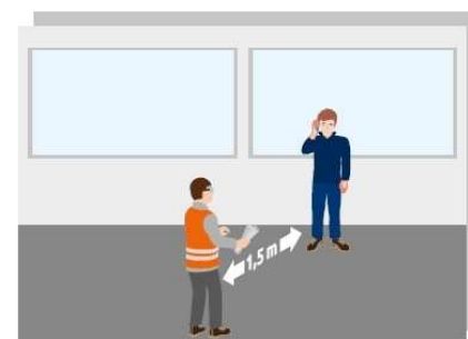
Zachowaj odstęp między uczestnikami, stosuj maseczkę ochronną